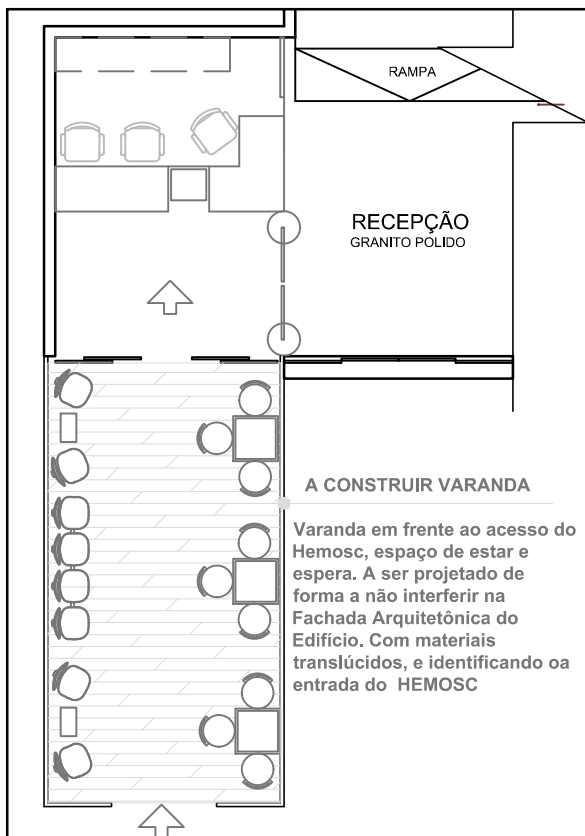
05 NOVO LAYOUT DE MOBILIÁRIO – RECEPÇÃO S/ ESC.